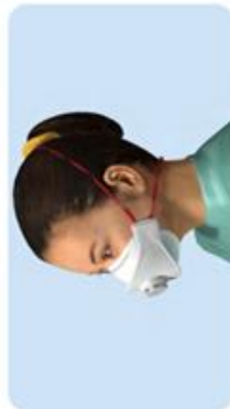
Haltebänder verdreht Haltebänder können drücken. Verleitet dazu, sich mit kontaminierten Händen an den Kopf zu fassen.