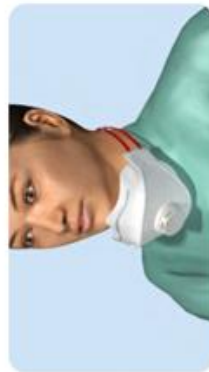
Maske um den Hals getragen Kontamination von Hals und Kinn durch Maske. Kontamination der Maskeninnenseite durch Mittel.