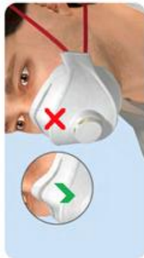
Nasenbügel nicht angepasst Kein Dichtsitz bei Bartträgern oder stark vernarbter Haut im Bereich der Dichtlippe.