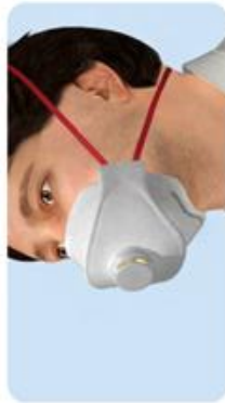
Maske verkehrt herum aufgesetzt Kein Dichtsitz der Maske möglich.