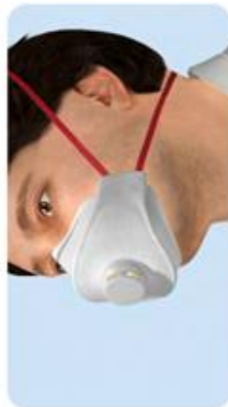
Maske nicht vollständig entfalt Kein Dichtsitz möglich, da Dichtlippe nicht am Kinn anliegt.