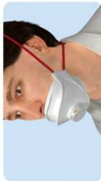
Maske nicht über Nase getragen Kein Schutz, da ungefilterte Atmung durch die Nase.