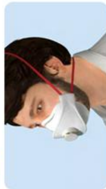
Maske mit Bart getragen Kein Dichtsitz bei Bartträgern oder stark vernarbter Haut im Bereich der Dichtlippe.