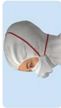
Maske über Kapuze getragen Kein Schutz der Schleimhäute durch Maske beim Absetzen der Kapuze.