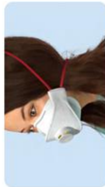
Haare nicht zusammen gebunden Kein Dichtsitz im Wangenbereich.