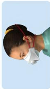
Haltebänder über die Ohren geführt Haltebänder können drücken. Verleitet dazu, sich mit kontaminierten Händen an den Kopf/an die Ohren zu fassen.