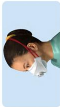
Haltebänder falsch positioniert Kein Dichtsitz, wenn Maske verrutscht.